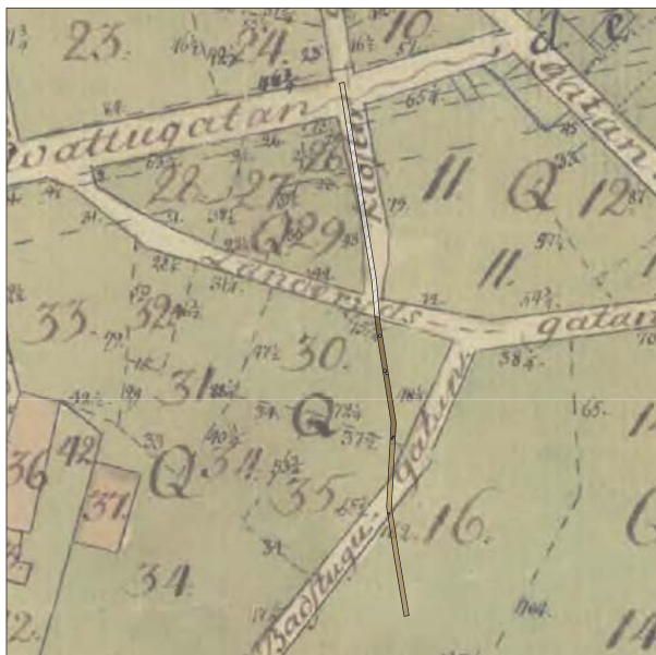
Figur 5. De påträffade lämningarna markerade på 1757 års karta. Skala 1:2000.

I den södra delen av sträckan var lagret relativt fyndtomt. Här kunde ett mörkare stråk noteras i kulturlagret. Mörkfärgningen var ca 0,6 m bred och ca 3 m lång och innehöll rikligt med ben och enstaka stenar och tegelbitar. Stråket sträckte sig diagonalt över schaktet men kunde inte urskiljas i profil. Då anläggningen likväl var tydlig i plan har den tolkats som botten av ett dike/ränna. Vid en jämförelse med det historiska kartmaterialet framgår att rännans läge överensstämmer med gränsen för gatu- och tomtmark. Dessvärre kunde inget daterande fyndmaterial iakttagas i anläggningen.