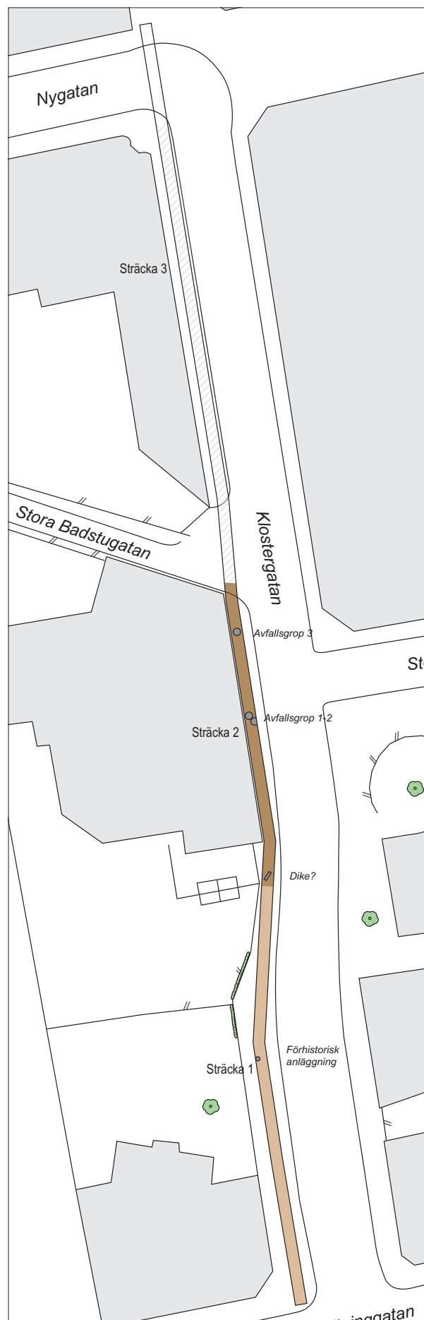
Figur 4. Grundkarta med det aktuella schaktet och lämningar inlagt.

Lämningarna inom sträcka 1 var mycket sparsamma och bestod främst av ett homogent kulturlager (L1). Lagret framkom på 0,3-0,6 m djup och var mellan 0,05-0,30 m tjockt. Det bestod av mörk gråbrun, något sandig, lera och innehöll enstaka småsten, tegel och ett fåtal fynd av yngre rödgods och djurben. Under kulturlagret förekom ställvis ett ca 0,1 m tjockt infiltrationslager. Kulturlagret har sannolikt tillkommit genom odling.