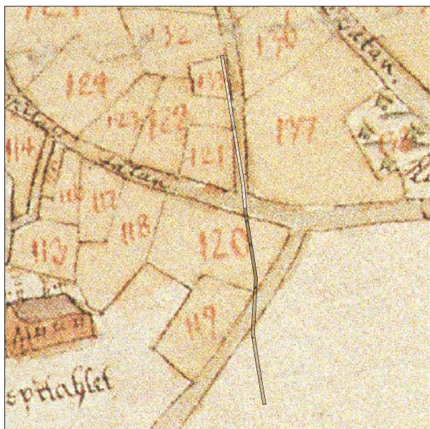
Figur 3. Utsnitt ur 1696 års karta med den aktuella schaktsträckningen markerad. Skala 1:2000.

Enligt 1696 års karta berörs såväl tomtmark och gatumark som obebyggt område av arbetet. På 1651 års stadskarta finns en föregångare till Klostergatan som sträckte sig söderut från Tanneforsgatan fram till Stora Badstugatan. Det är troligen denna gata som ursprungligen benämndes Klostergatan eftersom den låg i anslutning till stadens franciskanerkonvent (Ohlsén & Ternström 2001). Konventet grundades sannolikt år 1287 och dess placering i staden har länge varit omdiskuterad. Arkeologiska fynd och skriftliga källor pekar dock på att det legat i området söder om den medeltida Hospitalsgatan, det vill säga i området kring nuvarande Hospitalstorget (Tagesson 2002).