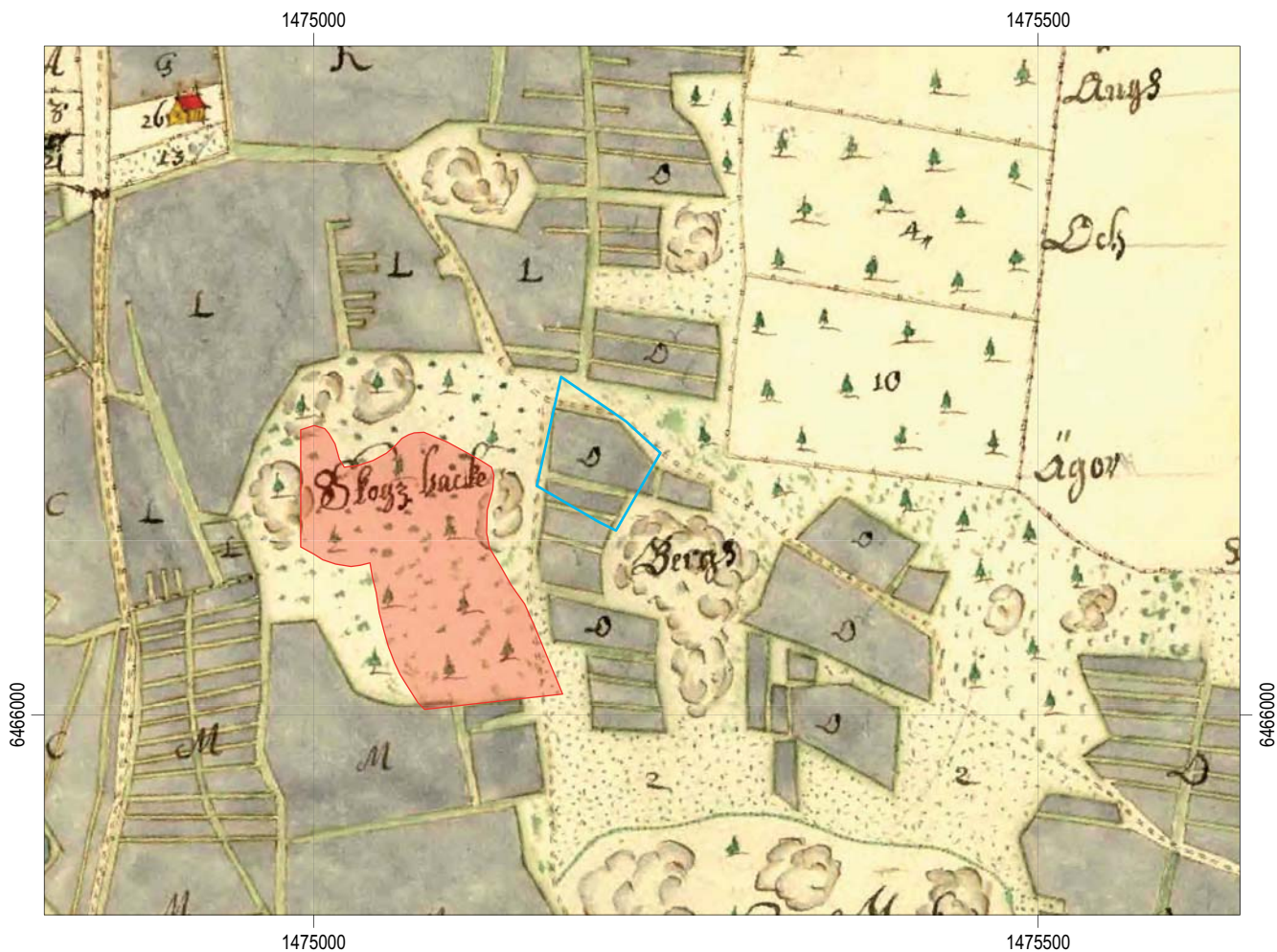
Figur 4. Utdrag ur geometrisk avmätning av Unnerstad 1699. (D25:45-1). Undersökningområdet och platsen för gravfältet RAÄ 16 markerade. Av kartan framgår att stora delar av åkerytan, till exempel den yta som är markerad M, fortfarande är parcellindelad på ett sätt som brukar associeras med medeltida förhållanden. Bytomten ligger nordväst om utredningsområdet. Den nuvarande östra delen av bytomten togs i anspråk först vid Laga skiftet 1877 (handling D25-45:4 i lantmäteristyrelsens arkiv). Skala 1:5 000.

Den arkeologiska förundersökningens resultat var också avsett att kunna utgöra underlag för Länsstyrelsens fortsatta bedömningar i ärendet.