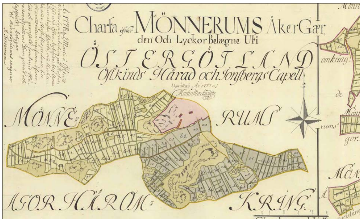
Figur 4. Mönnerum 1777 (LST akt D43-58:2).

Endast vid ladugården till Möckeläng 1:12 framkom något av arkeologiskt intresse. Här kunde ett ovanligt tjockt matjordslager konstateras i åkermar-