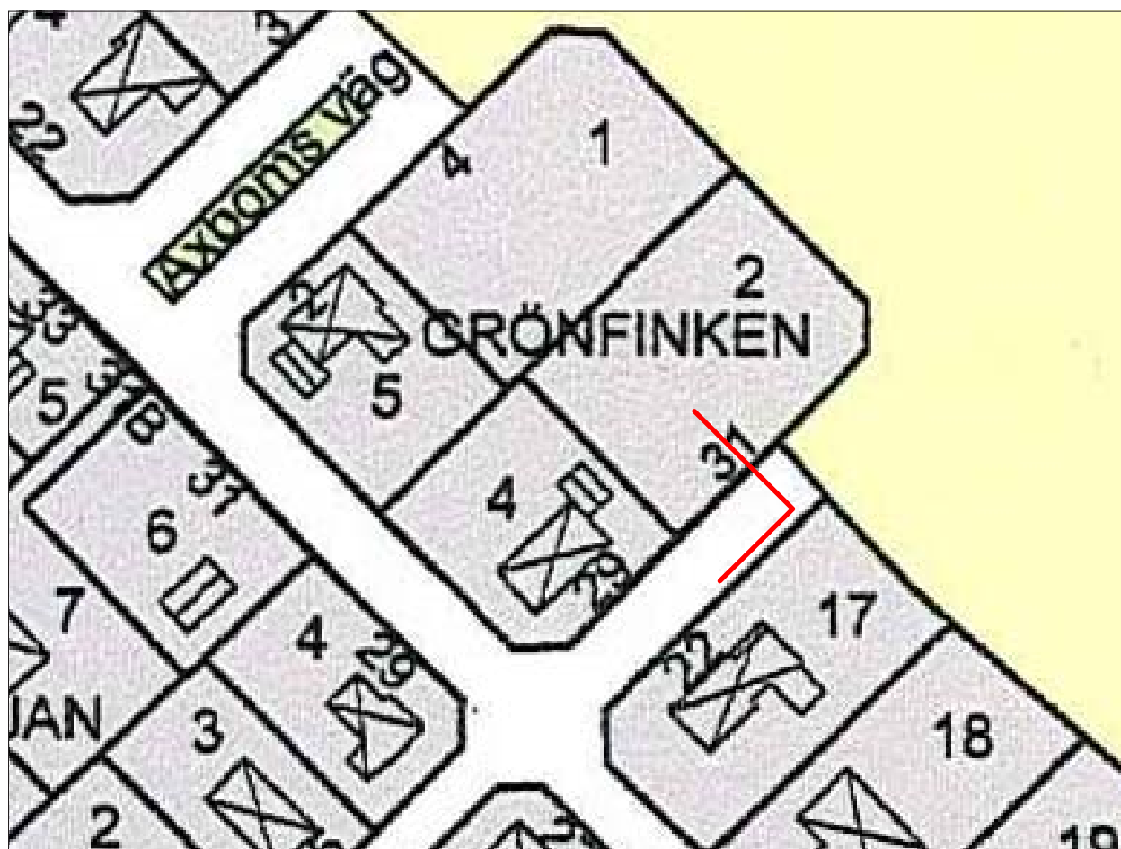
Figur 3. Utsnitt ur Adresskarta för Skänninge stad, upprättad av Byggnadskontoret 2006. Schaktet markerat med rött. Skala 1:1000.

Stadens två äldsta stenkyrkor, Allhelgonakyrkan (RAÅ 11, Skänninge) och S:t Martins kyrka (ingår i RAÅ 1, Skänninge), var belägna på varsin sida om Skenaån. De dateras båda till 1100-talet. S:t Martins kyrka, väster om Skenaån, omnämns första gången i en donationshandling som upprättades senast år 1275 till förmån för ett blivande nunnekloster, S:ta Ingridis kloster (DS 885). Huruvida kyrkan revs eller om den bara anpassades till en ny funktion som klosterkyrka är oklart. Vid undersökningar 1939 påträffades tre i stort sett intakta gravar med s k Eskilstunakistor (Wallenberg 1984).