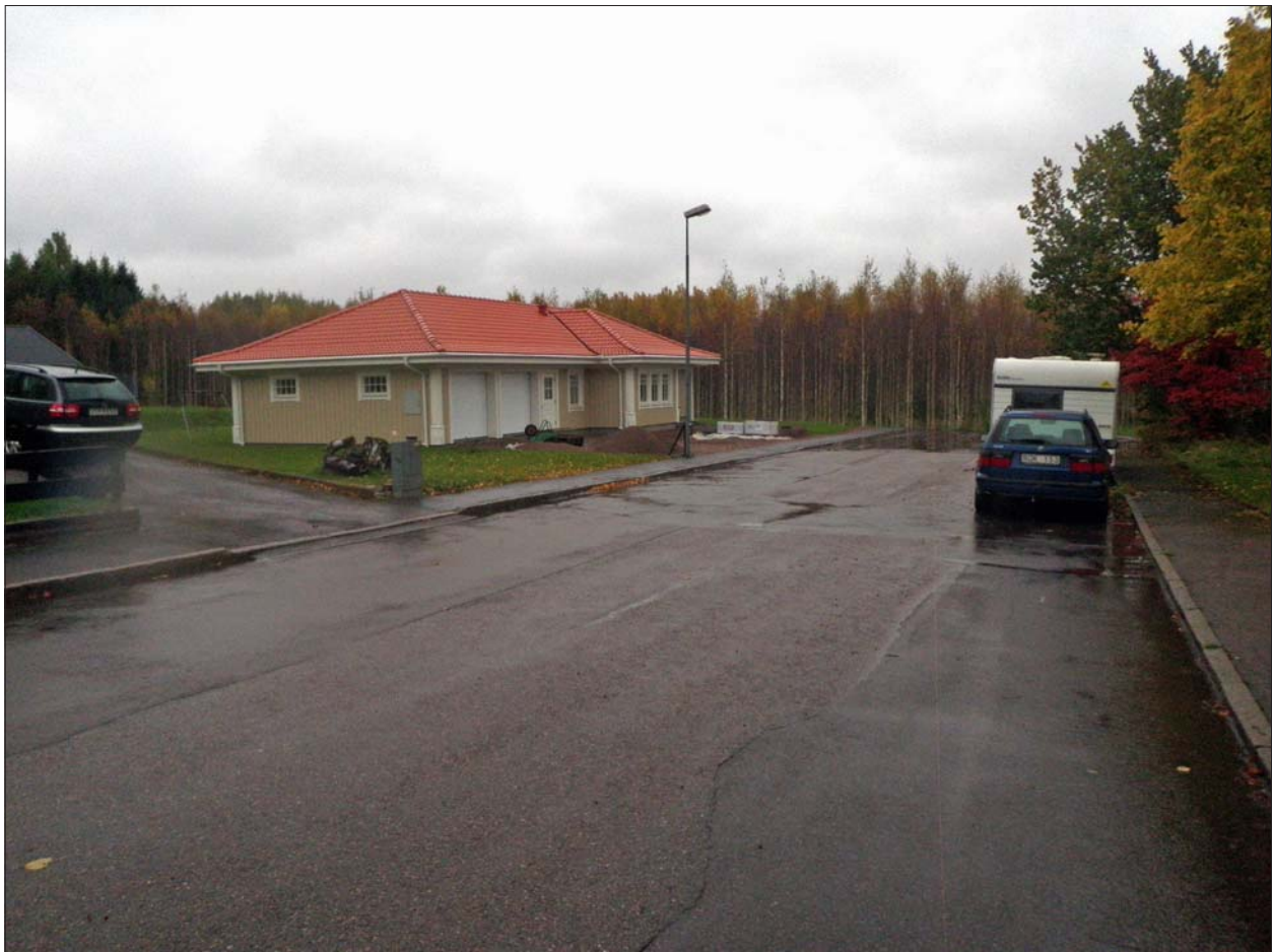
Figur 4. S:t Martins väg 31 i oktober 2010. Fjärrvärmeschaktet syns som lagning i asfalten och löper till höger i bild fram till den parkerade bilen, varifrån det viker tvärs över gatan för att ansluta till den nybyggda villan.

Det är betydelsefullt för tolkningen av Skänninges medeltida utveckling att fastställa kulturlagrens utbredning i stadens utkanter under olika perioder av medeltiden. Någon säker begränsning av dessa lämningar har inte tidigare kunnat göras. I närheten