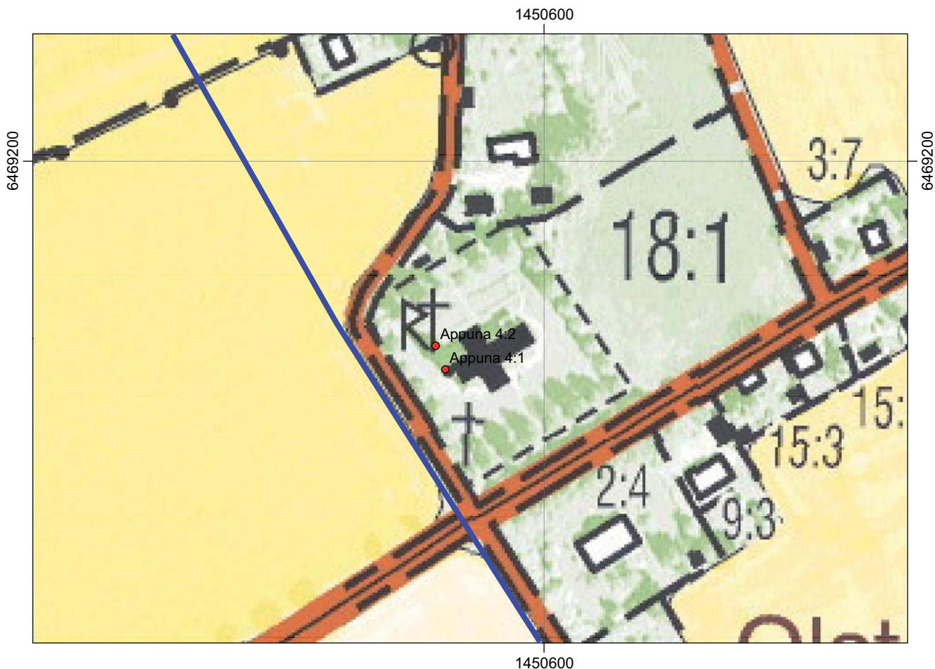
Figur 3. Område 1. Ledningsschaktet (blått) passerar väster om kyrkogården, De kända fornlämningarna är RAÄ 4:1, en runsten och 4:2, kyrkplats och kyrkogård. Utdrag ur den digitala fastighetskartan. Skala 1:2 000.