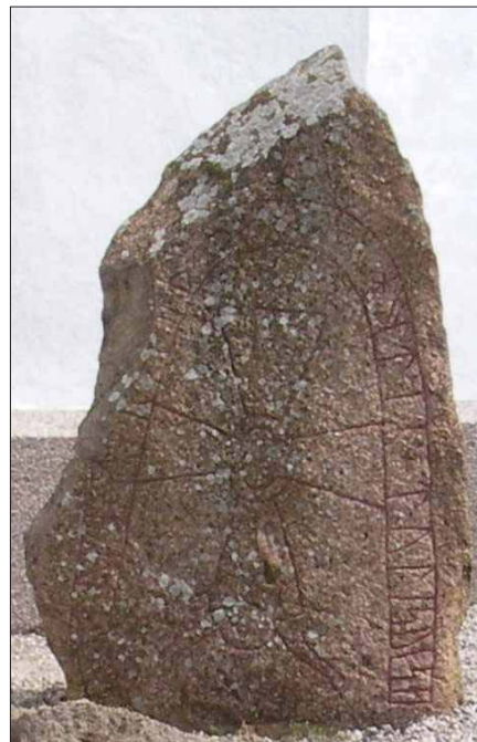
Figur 4. Runsten vid Appuna kyrka.

Här bedömdes elkabeln kunna plöjas ned i åkern väster om kyrkan utan att schaktövervakning var nödvändig.