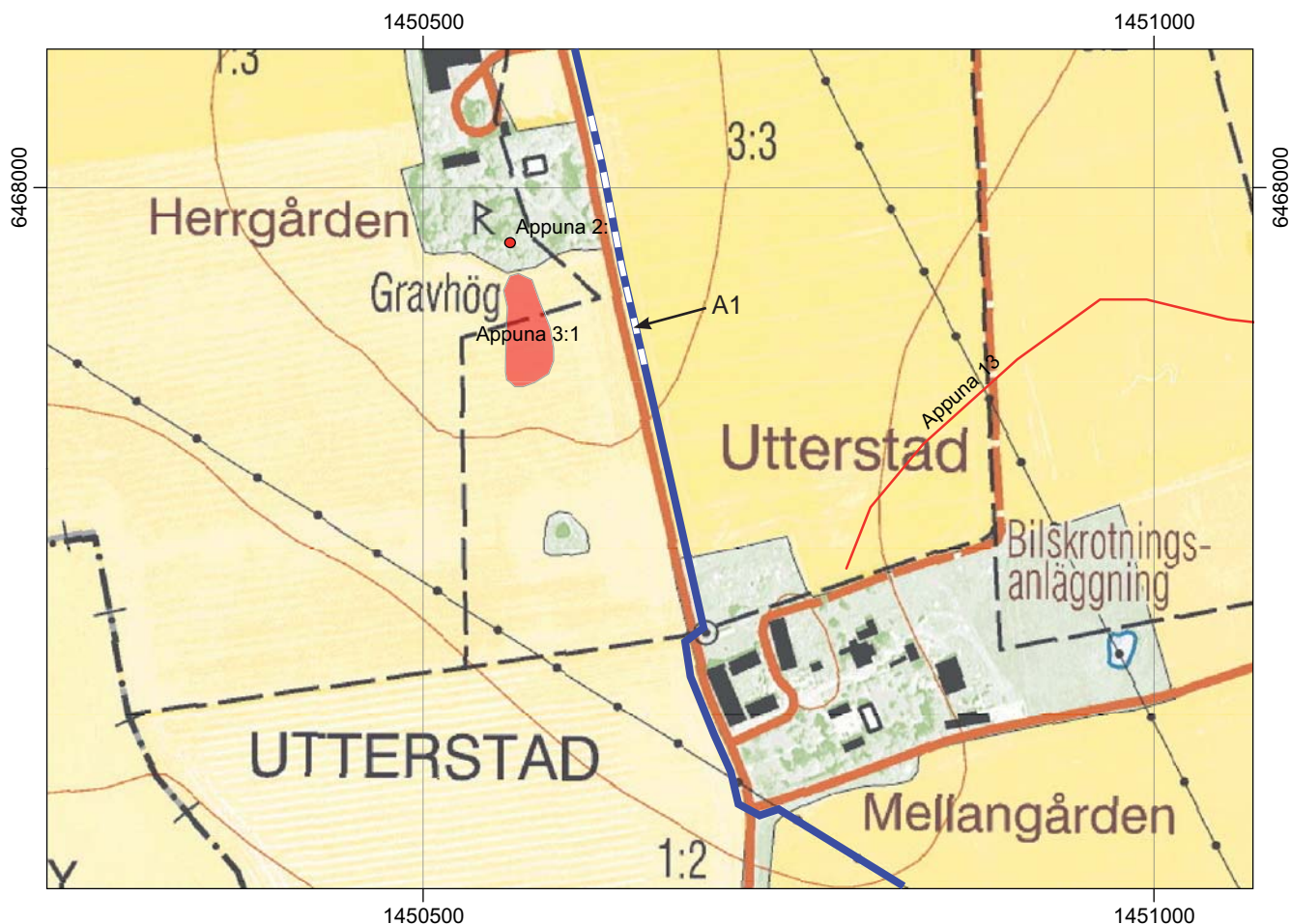
Figur 5. Område 2. Ledningsdragningen (blått) med schakten (rött) passerar på andra sidan vägen från fornlämningarna RAÄ 2 och 3 i Appuna socken. Utdrag ur den digitala fastighetskartan. Skala 1:5 000.