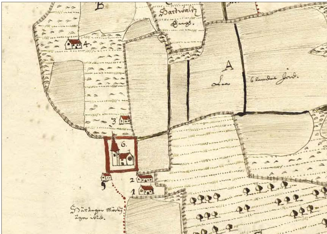
Figur 3. Ekeby by 1642. Tre av gårdarna ligger i samma lägen som idag medan gårdarna 3 och 4 är placerade norr om kyrkan. Kyrkogården, som för ovanlighetens skull är större i norr än i söder, har samma utsträckning som idag.

Nuvarande kyrkogårds omfattning och utbredning är densamma som på storskifteskartan över Ekeby från 1770. En skillnad är att en stiglucka mitt i södra bogårdsmuren återges på skifteskartan och att något slags byggnad ligger i kyrkogårdens nordöstra hörn. Bogårdsmuren är bedömd som kulturhistoriskt värdefull.