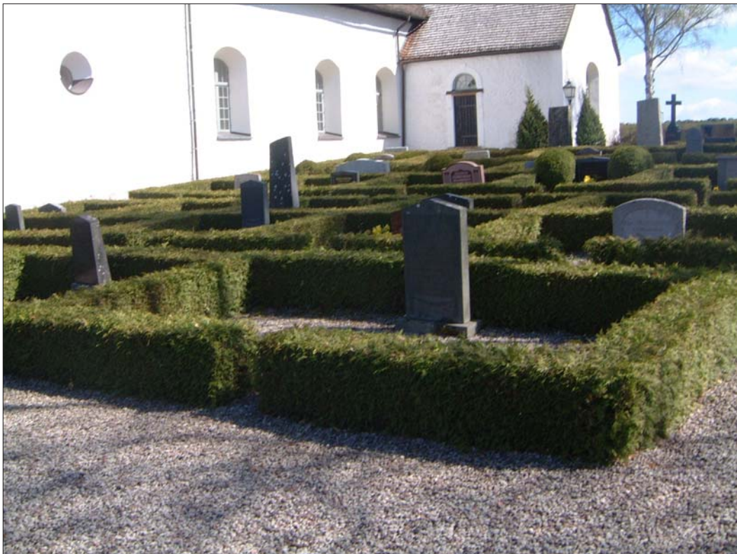
Figur 4. Bland de kulturhistoriskt intressanta dragen på kyrkogården hör att ett helt kvarter med grusade gravar omgivna av häckar har bevarats i söder. Kvarter av denna typ var vanliga under första delen av 1900-talet men har i de flesta fall tagits bort under senare år på grund av att de kräver mycket skötsel.

Till följd av detta påträffades heller inga intakta gravar. Schaktningen berörde endast kyrkogårdsjord innehållande lösa skelettrester som alla återbegravdes.