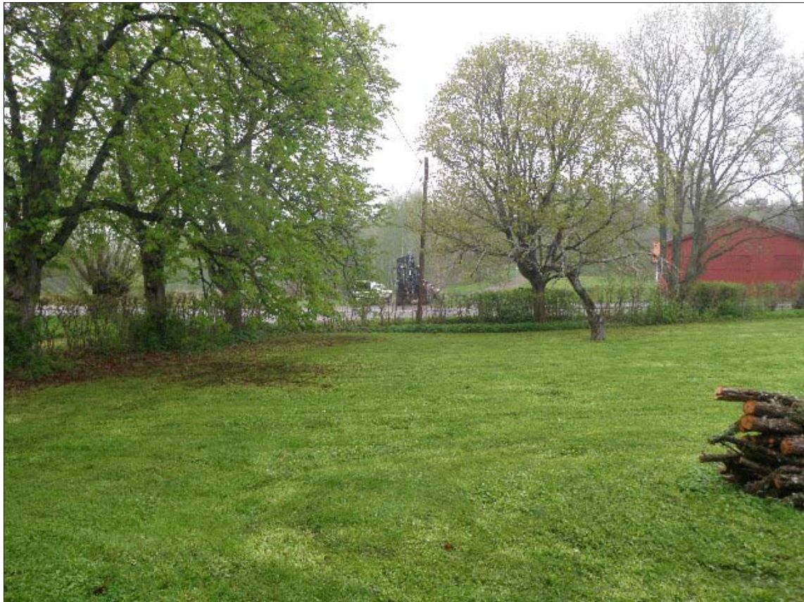
Figur 5. Kabelsträckan mot Ö.