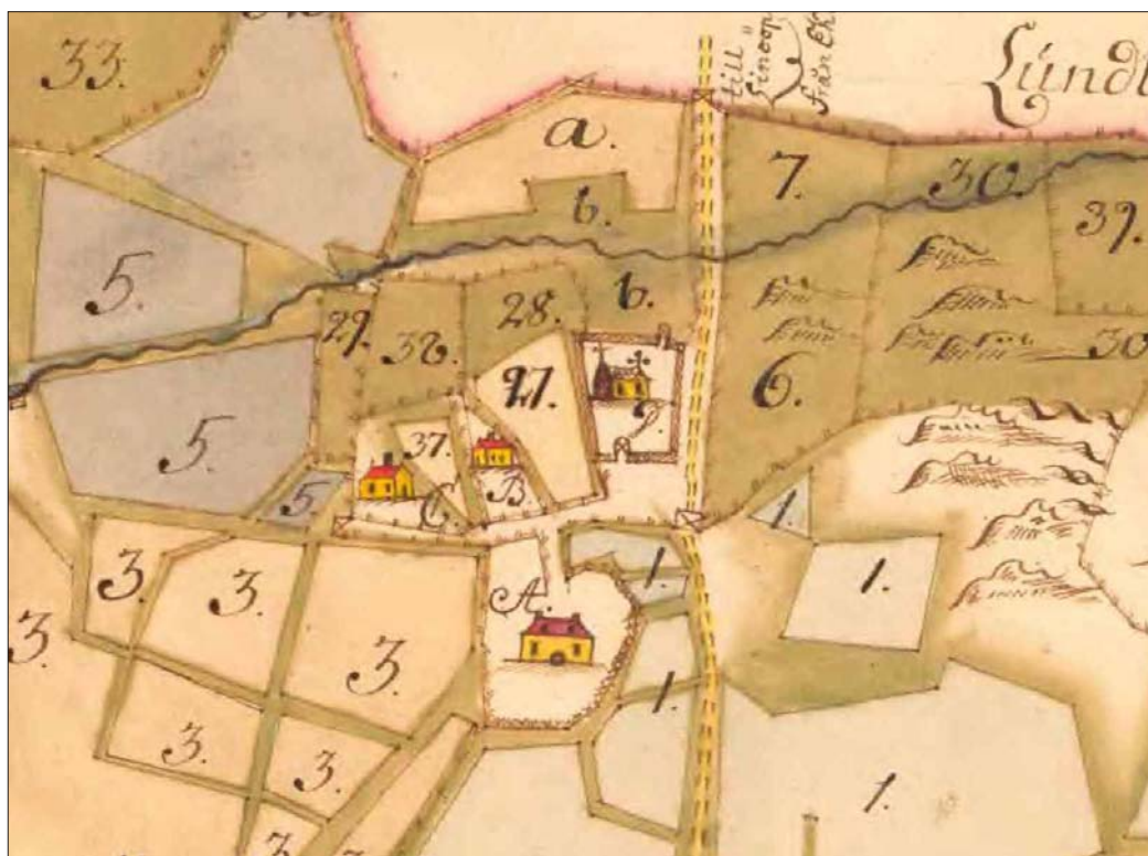
Figur 3. Utsnitt ur geometrisk avmätningsskarta från 1722 över Sörby (Sundvall 1722). På kartan är bytomtens utsträckning, (numera RAÄ 271) markerad liksom den gamla Smålandsvägens (numera RAÄ 275) sträckning genom byns område. Dessutom finns en skissartad avritning av den rivna kyrkan samt kyrkogården. Sistnämnda har idag grindar mot öster och inte som på kartan mot söder och nordöst.

Sörbyområdet innehåller ett stort antal fornlämningar. Genom den gamla bytomten, RAÄ 271, löper den äldre vägen från Boxholm mot Mjölby, Smålandsvägen eller RAÄ 275. Sörby var tidigare egen församling och dess kyrkogård som fortfarande är i bruk ansluter till vägen och bytomten. På kyrkogården finns ruinen av den medeltida kyrkan, RAÄ 43, och en runsten, RAÄ 41. Norr om kyrkogården finns två gravfält, RAÄ 44 och 58 som antagligen utgjort bygravfält till Sörby by. Öster om den kulturhistoriskt intressanta rundlogen, byggnadsminne sedan 1993,