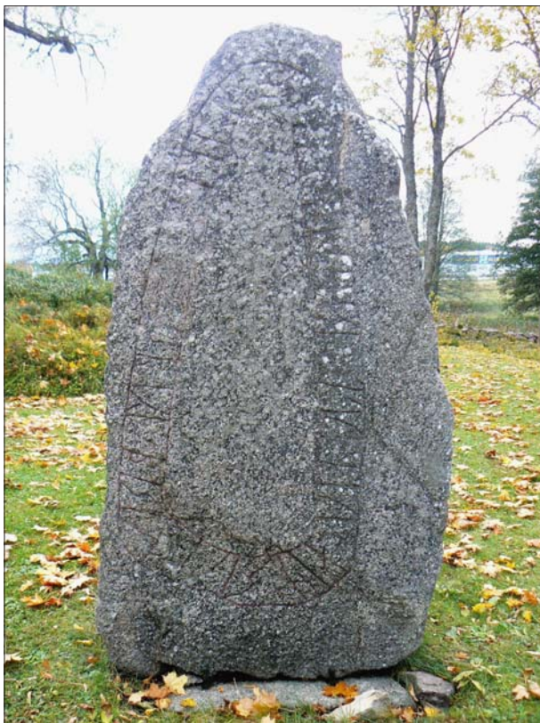
Figur 4. Sörbysten ÖGL 197. Runstenen på Sörby kyrkogård, ÖGL 197.

finns ett antal osäkra lämningar i form av rösen och stensättningar, RAÄ 92, 273 och 274. Området utgör en väl sammanhållen kulturmiljö som ingår i länsstyrelsens kulturminnesprogram (K51 Mjölby kommun). Vid en arkeologisk utredning 2005 (Lundberg 2006) genomfördes ett flertal sökschakt bland annat inom Sörby bytomts södra utkant. Vid detta tillfälle framkom flera förhistoriska anläggningar som givits egna nummer i FMIS, RAÄ 272, 277, 278 och 279.