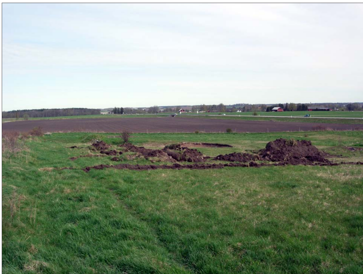
Figur 3. Sökschakt på undersökningsområdet.

På den nu aktuella moränhöjden, direkt väster om väg 36, återfinns i dess södra del en skålgropsförekomst bestående av 22 skålgropar (RAÄ 27, Kaga sn). Skålgroparna är 2 till 7 cm i diameter, 0,5 till 3,5 cm djupa och belägna på ett 0,8 x 0,6 m stort stenblock. Närheten till den kända fornlämningen indikerar att området på den aktuella höjdryggen kan innehålla ej tidigare kända fornlämningar under nuvarande markyta.