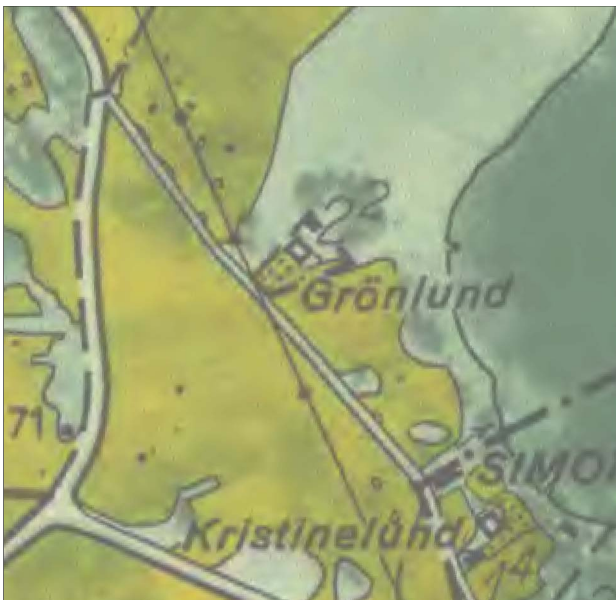
Figur 4. Byggnaderna som de ligger på Ekonomiska kartan från 1947. Skala 1:2 000.

sydvästlig-nordöstlig riktning. Sydöst om stenraden bestod marken av ett ca 0,6 m tjockt matjords- och lerlager medan marken nordväst därom var stenig morän. I jordfyllningen som omgav stenarna framkom taktegel, buteljglas, djurben och recent keramik. Fynden pekar på en datering till 1800-talet. Stenraden har samma orientering som tomtgränsen och den byggnad som finns med på 1947 års Ekonomiska karta men som idag har blivit ersatt med ett nyare fritidshus med en något annorlunda orientering (jmf figur 4 och 5). Stenraden tycks dock ligga något mer åt sydväst än byggnaden på 1947 års karta vilket skulle kunna tyda på att huset är något felkarterat eller att den nu påträffade stenraden är en kantförstärkning mellan tomt och slänten ner mot grustaget.