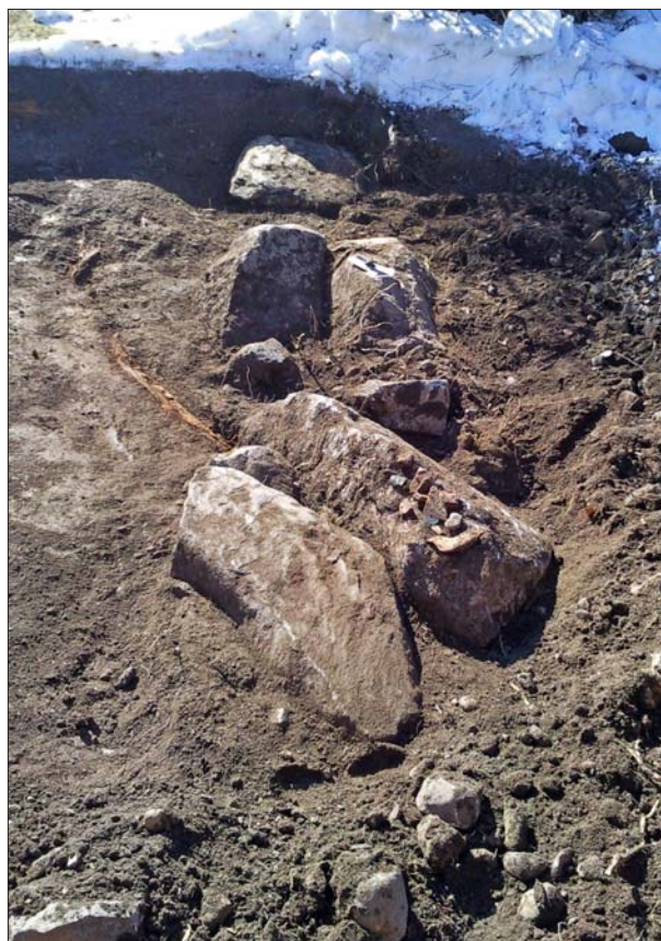
Figur 3. Stenraden mot Sydväst.

Den arkeologiska förundersökningen genomfördes i samband med schaktandet för husgrunden och omfattade ca 30 m 2 av de totalt ca 65 m 2 . Övrig yta sammanföll med frischakt för det befintliga huset och områden som av terrängmässiga förhållanden inte ansågs kunna innehålla fast fornlämning. Då tillbyggnaden skulle byggas på torpargrund, grävdes en ca 1