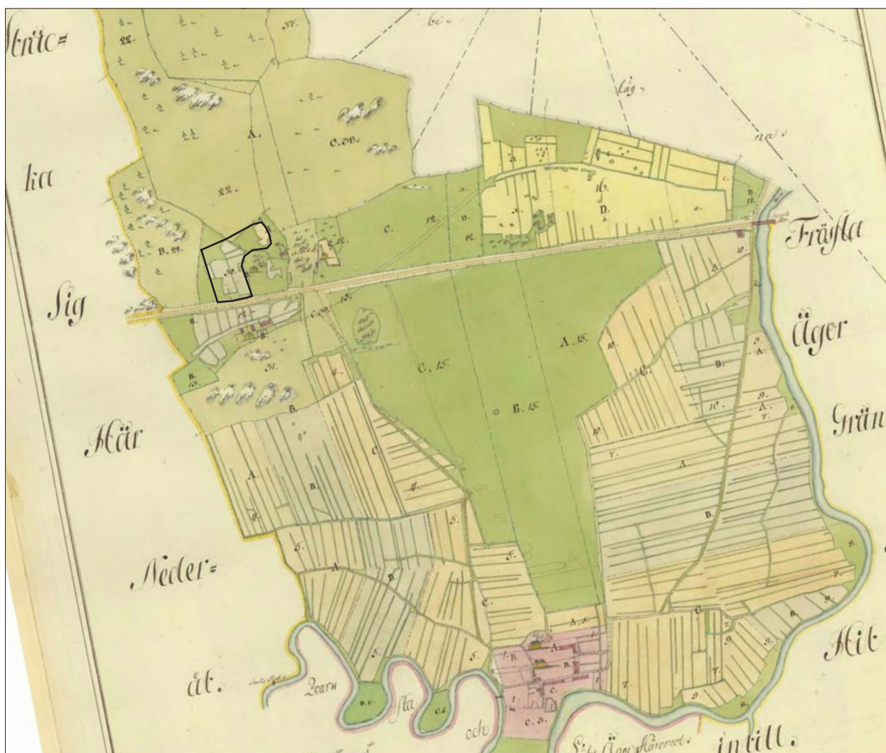
Figur 4. Utsnitt ur 1784 års storskifteskarta (D127-30:1, Ånestad, Vikingstad socken) visande Ånestad med utredningsområdet markerat. Det aktuella utredningsområdet är åkermarken märkt 30 samt A nordväst om densamma samt området mellan dessa beteckningar. Hela området ligger som inägomark till Ånestadlund, fastighet B.

Inga indikationer på fornlämning framkom, varför Östergötlands länsmuseum inte anser att vidare arkeologiska åtgärder är nödvändiga.