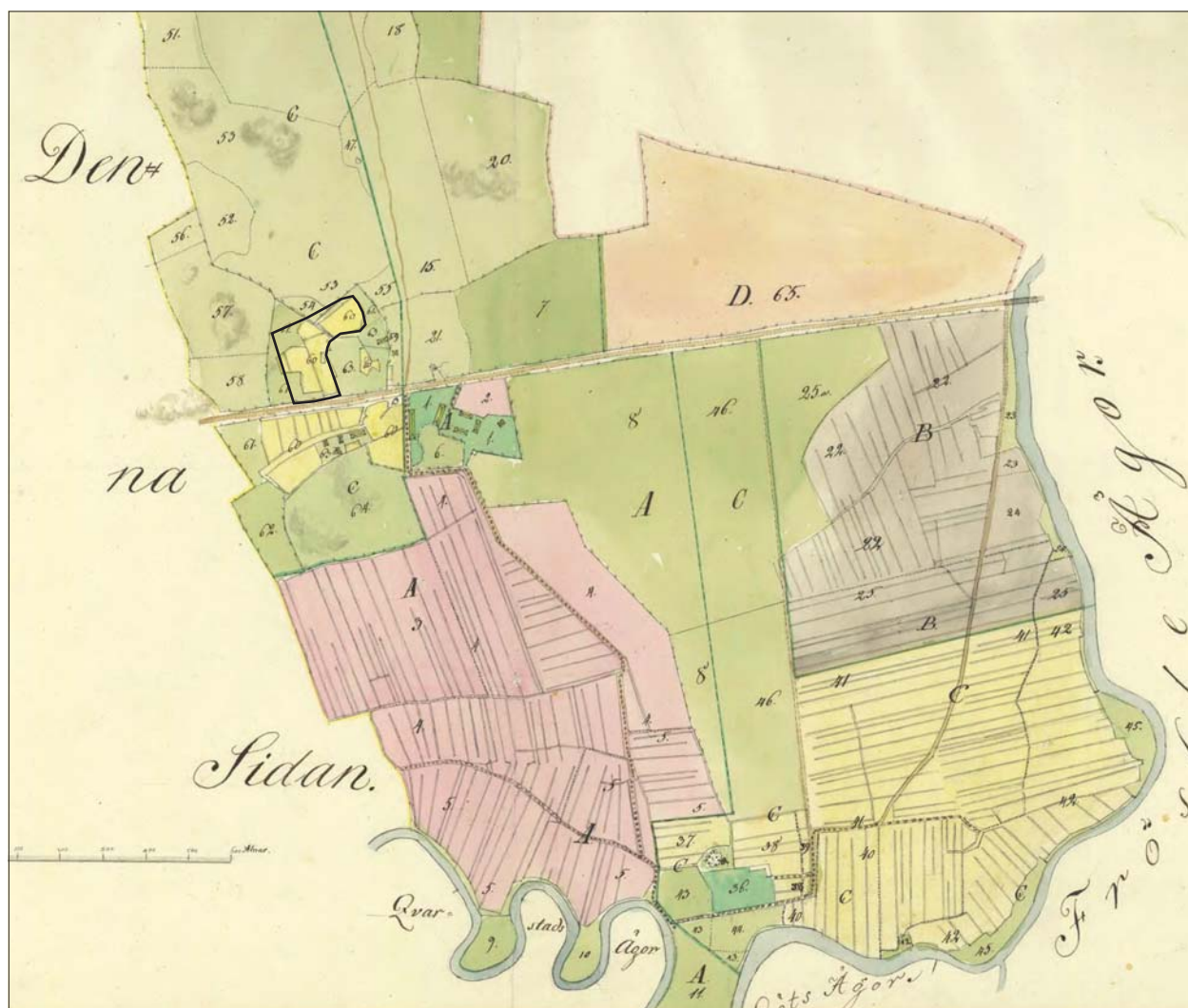
Figur 5. Utsnitt ur 1825 års enskifteskarta (D127-30:2, Ånestad, Vikingstad socken) visande Ånestad med utredningsområdet markerat. De två åkrarna är sammanslagna till en, fig 60, som i norr och väster sträcker sig utanför dagens åkermark.

D127-30:2, Ånestad, Vikingstad socken Enskifte 1825