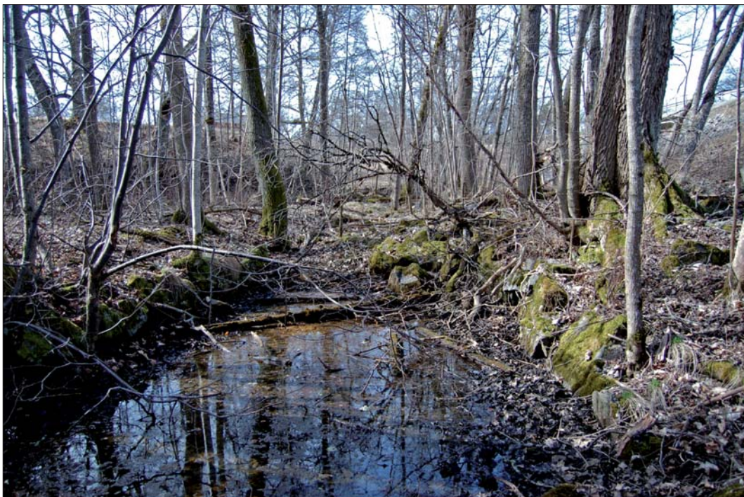
Figur 5. Del av stensatt vattenränna vid RAÄ 175, Risinge sn, från SÖ. Vattenrännan, belägen söder om väg 51, har med största sannolikhet nyttjats som kraftutvinning till den i området tidigare belägna Börsjö hammare. Hammaren omnämns första gången år 1627. Vid utredningstillfället skedde en revidering av hammarområdets geometri, beskrivning och antikvariska status enligt idag gällande antikvariska praxis.