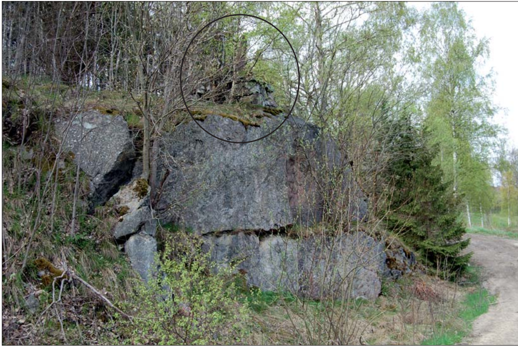
Figur 4. Milstolpe, RAÄ 7, Risinge sn belägen på yttersta delen av nedsprängd bergklack, från NÖ. Milstolpen kan ses inringad i bildens mittersta del och är belägen direkt SV om vägens äldre sträckning. Avståndet till dagens vägbanan är ca 15 m. Milstolpar sattes upp i samband med att gästgiverförordningen tillkom år 1649. De flesta milstolpar restes under 1700-talet. Utefter aktuell vägsträcka inom Risinge socken fanns förr två gästgivaregårdar, dels i Melby, dels i Gammalstorp beläget V om Finspång (Widegren 1828:148).