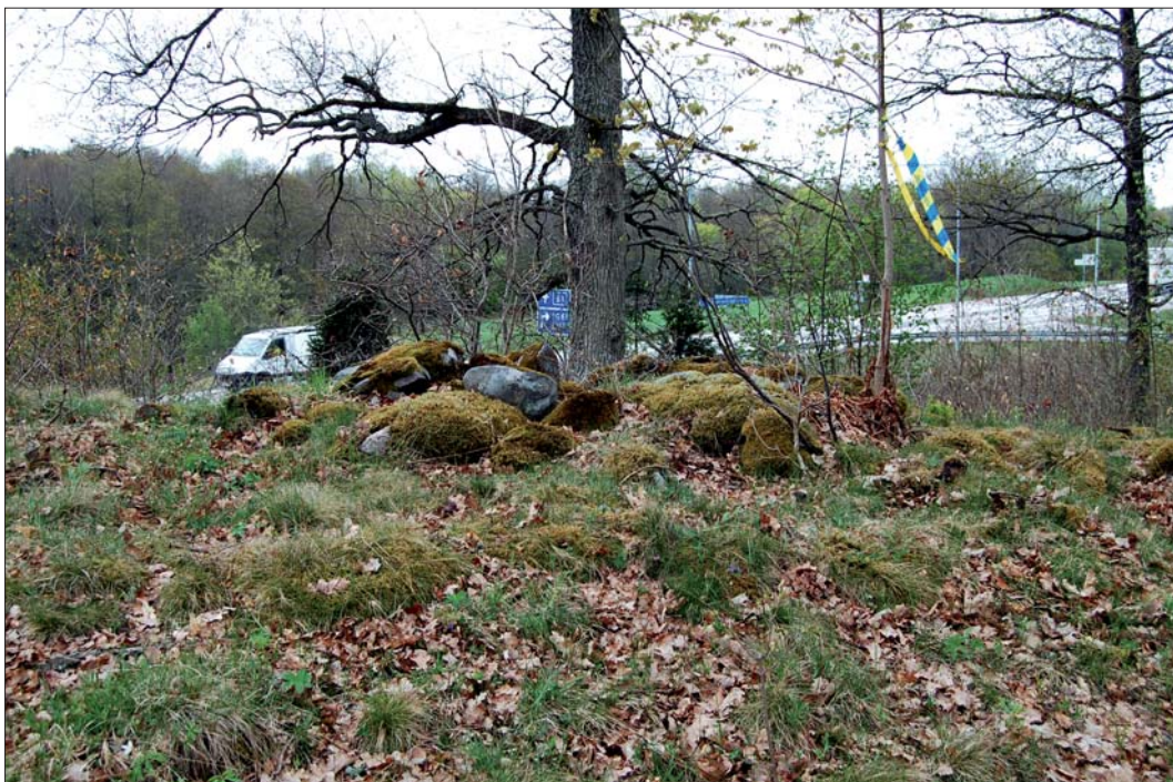
Figur 6. Stensättning, RAÄ 183, Risinge sn belägen på moränbunden mindre bergsrygg N om väg 51, från NÖ. Vid utredningstillfället skedde en revidering av forn lämningens geometri, beskrivning och antikvariska status. Vid eventuell exploatering som medför intrång bör en arkeologisk förundersökning vidtas.

I och med att misstaget upptäcktes vid utredningstillfället reviderades uppgifterna i fornminnesregistret. RAÄ 183, Risinge socken utgörs numera av en fast forn lämning i form av en stensättning. Stensättningen är rund, 6-7 m i diameter och 0,3 m hög, med stenfyllning av 0,3-0,6 m stora stenar. Den är belägen på en moränbunden bergsrygg, ca 20 m N om aktuell väg bana.