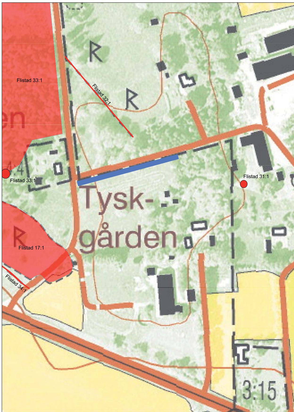
Figur 3. Utdrag ur digitala Fastighetskartan (8F6f) med fornlämningar och sökschaktad sträcka (blått) markerat. Skala 1:2 000.