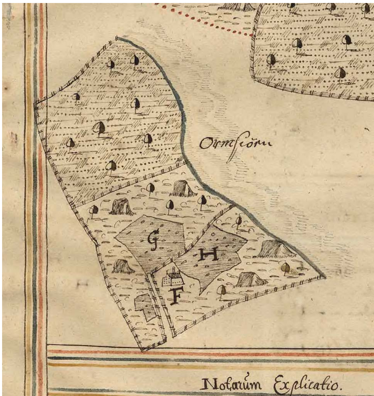
Figur 3. Utdrag ur geometrisk jordebokskarta från år 1638 som visar läget för Ormsjötorp kronohemman. Gården var belägen på Ormsjöns västra sida, ca 150 m NÖ om RAÄ 142, i ett idag bebyggt sommarstugeområde.