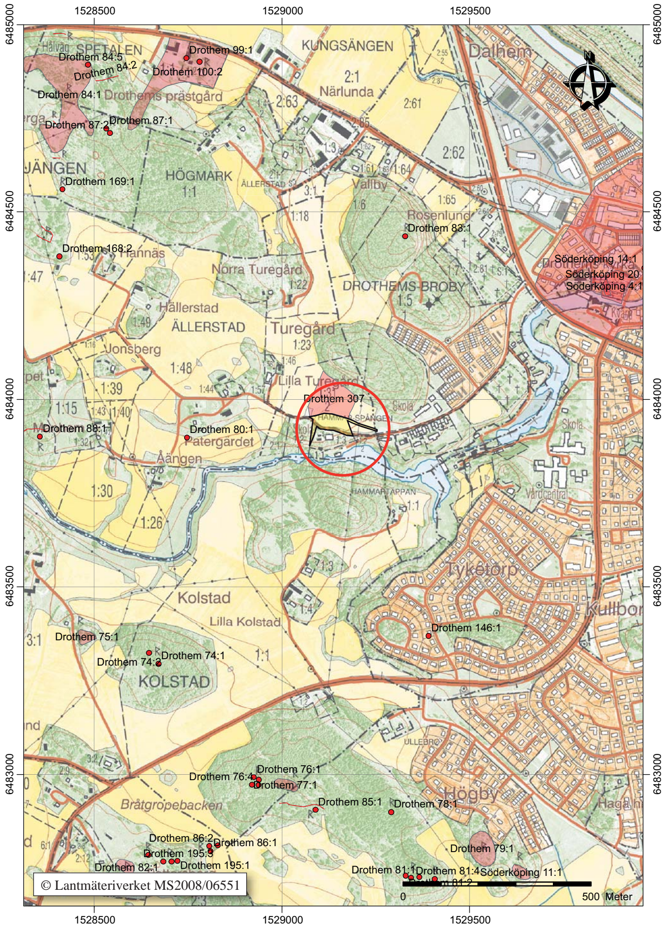
Figur 2. Utdrag ur digitala Fastighetskartan med undersökningsområdet markerat. Skala 1:10 000.