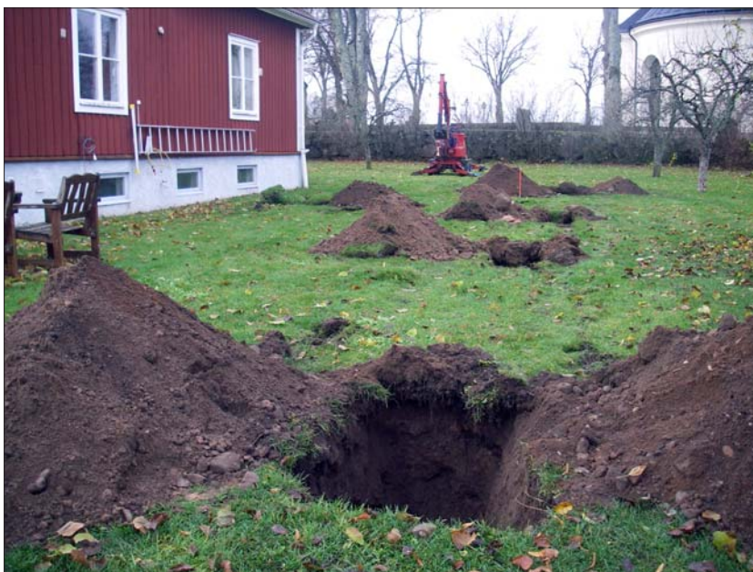
Figur 6. Klockaregården sedd från nordöst. På bilden syns schakten norr om byggnaden och i bakgrunden Rappestad kyrka.

för att användas som utfyllnadsmaterial. Under detta påförda lager påträffades den äldre matjordsnivån, som bestod av ett ca 0,3 m tjockt matjordslager utan synliga inslag av kulturpåverkan. Den sterila undergrunden nåddes på ett djup av ca 0,7 m. Inga lämningar av arkeologiskt intresse påträffades i något av schakten.