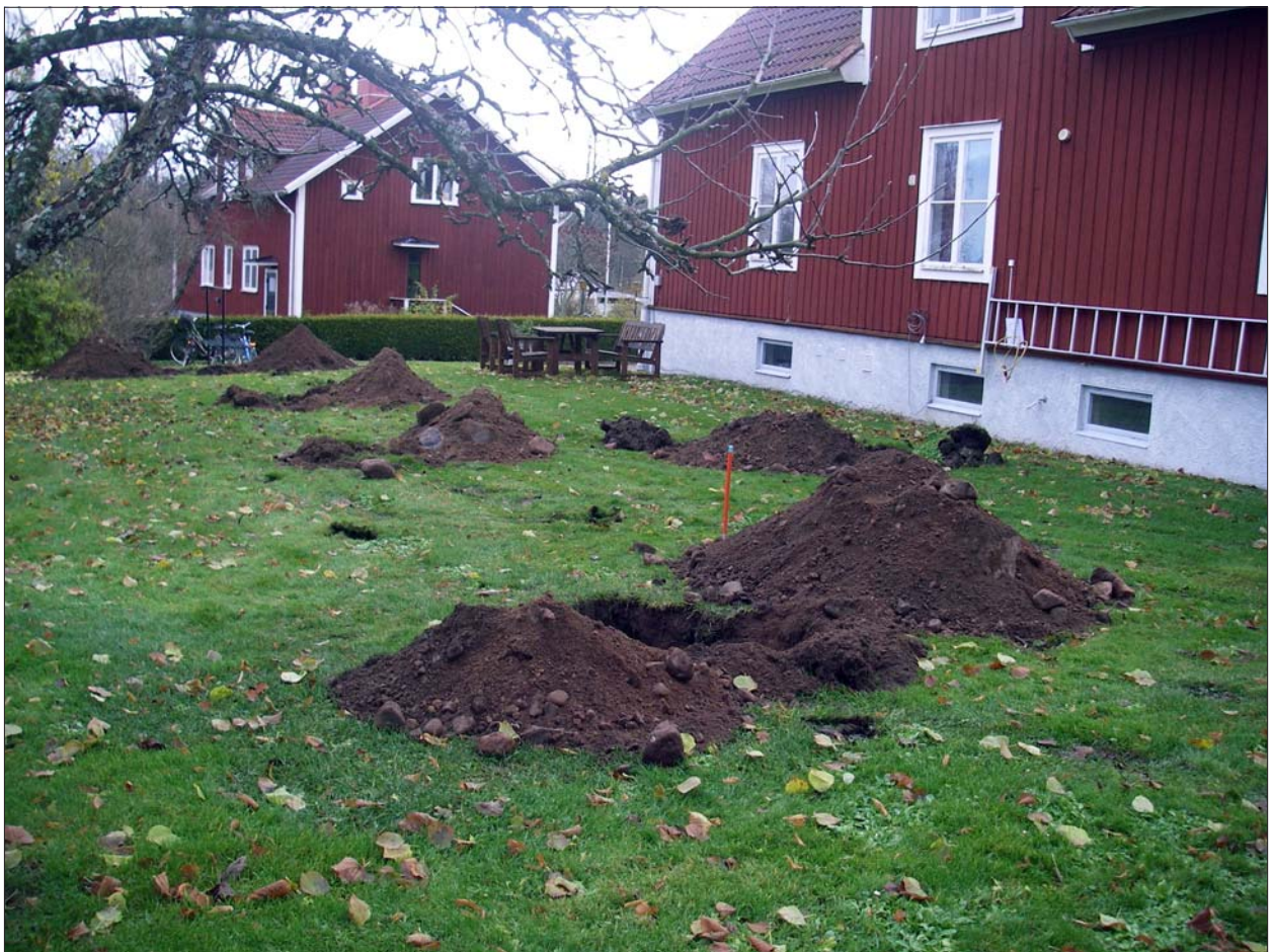
Figur 5. Ytan med schakten norr om Klockaregården sedd från nordväst.