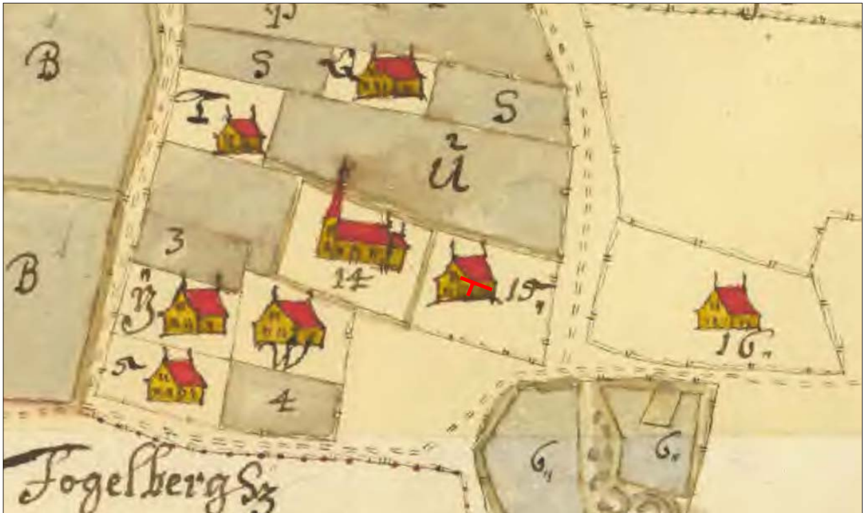
Figur 4. Utdrag ur sockenkartan från år 1699 visandes Rappestad by med schakten markerade. Skala 1:2 500.