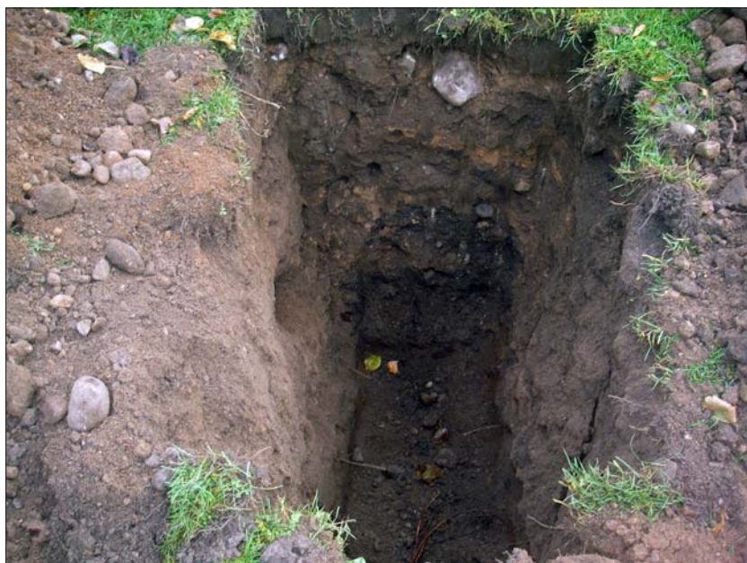
Figur 7. Fyllningen i schakten bestod delvis av utfyllnadsmassor med tegelfragment och stenar. Under detta lager påträffades den äldre matjorden på ett djup av ca 0,4 m under den nuvarande markytan.