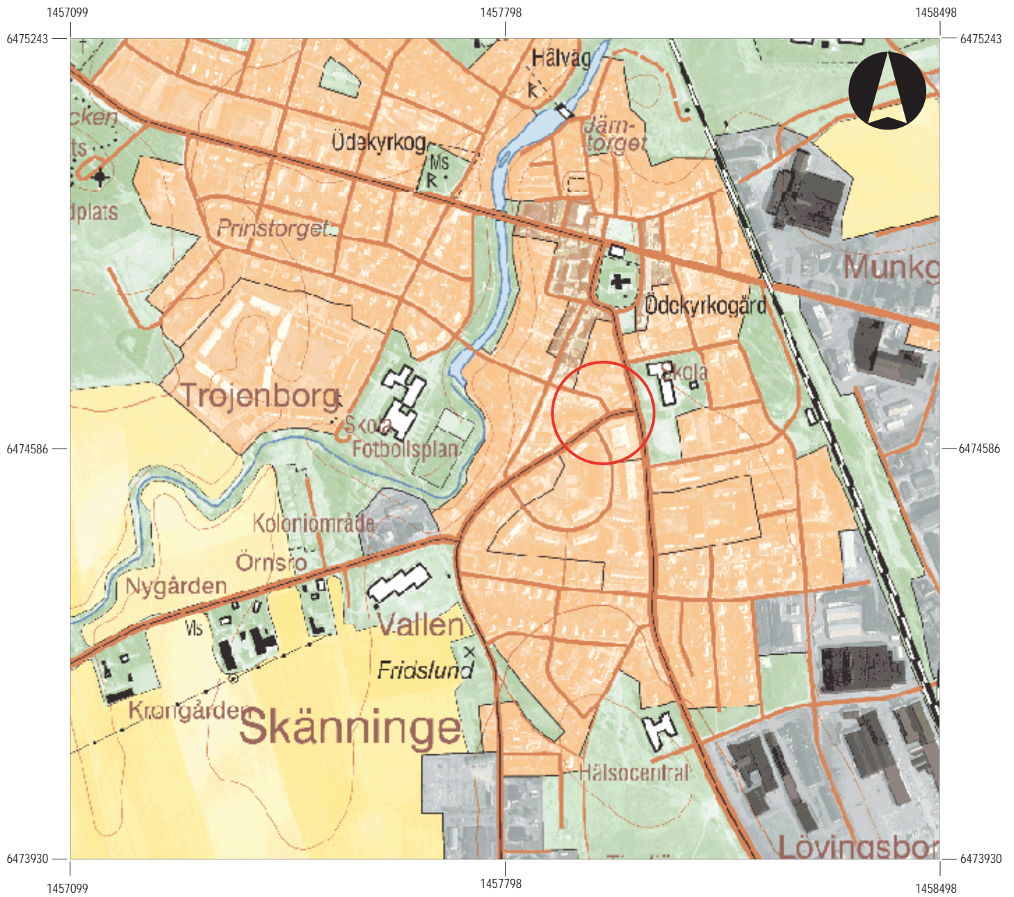
Figur 2. Utdrag ur digitala Fastighetskartan med undersökningsområdet markerat. Skala 1:5 000.