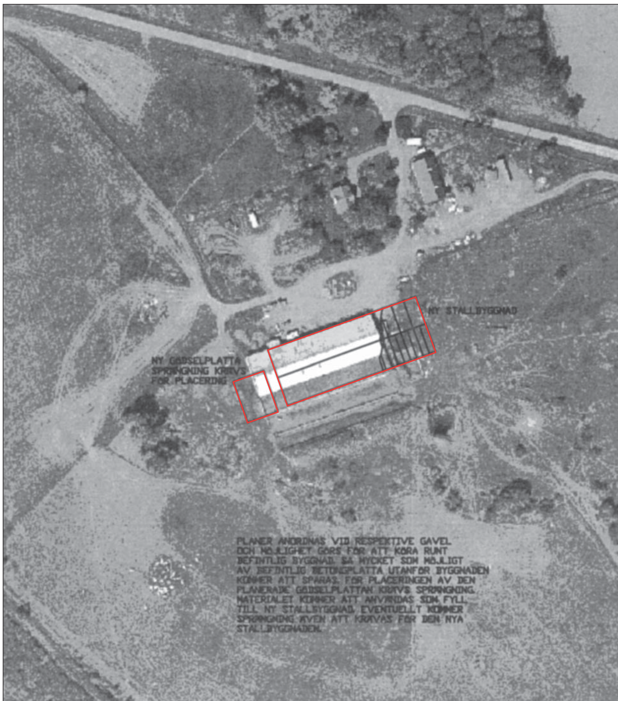
Figur 4. S/V flygfoto med den nya ladugården inritad över den gamla ladugården.