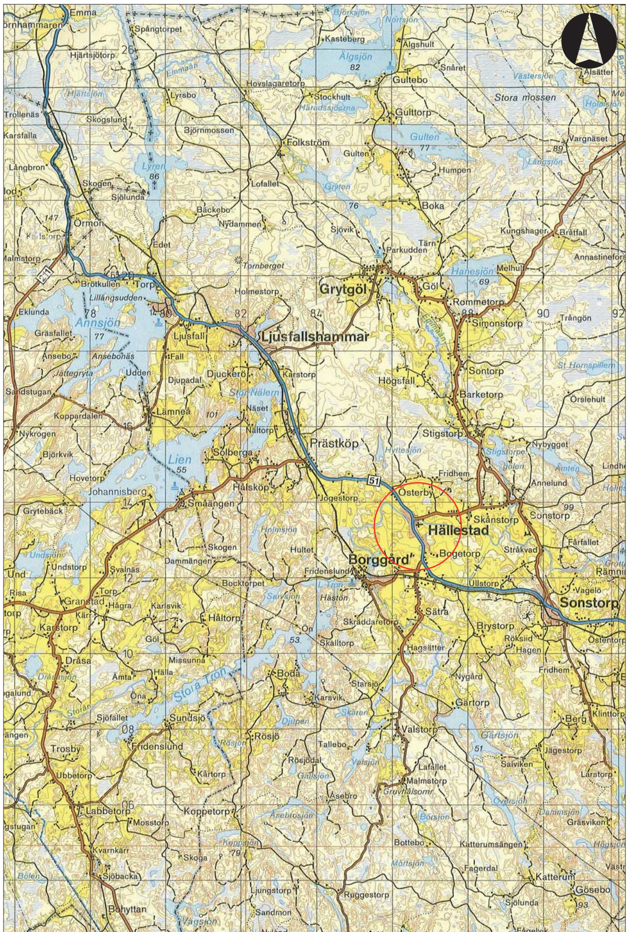
Figur 2. Utdrag ur Vägkartans blad 94 Finspång, med aktuellt område markerat. Skala 1:100 000.