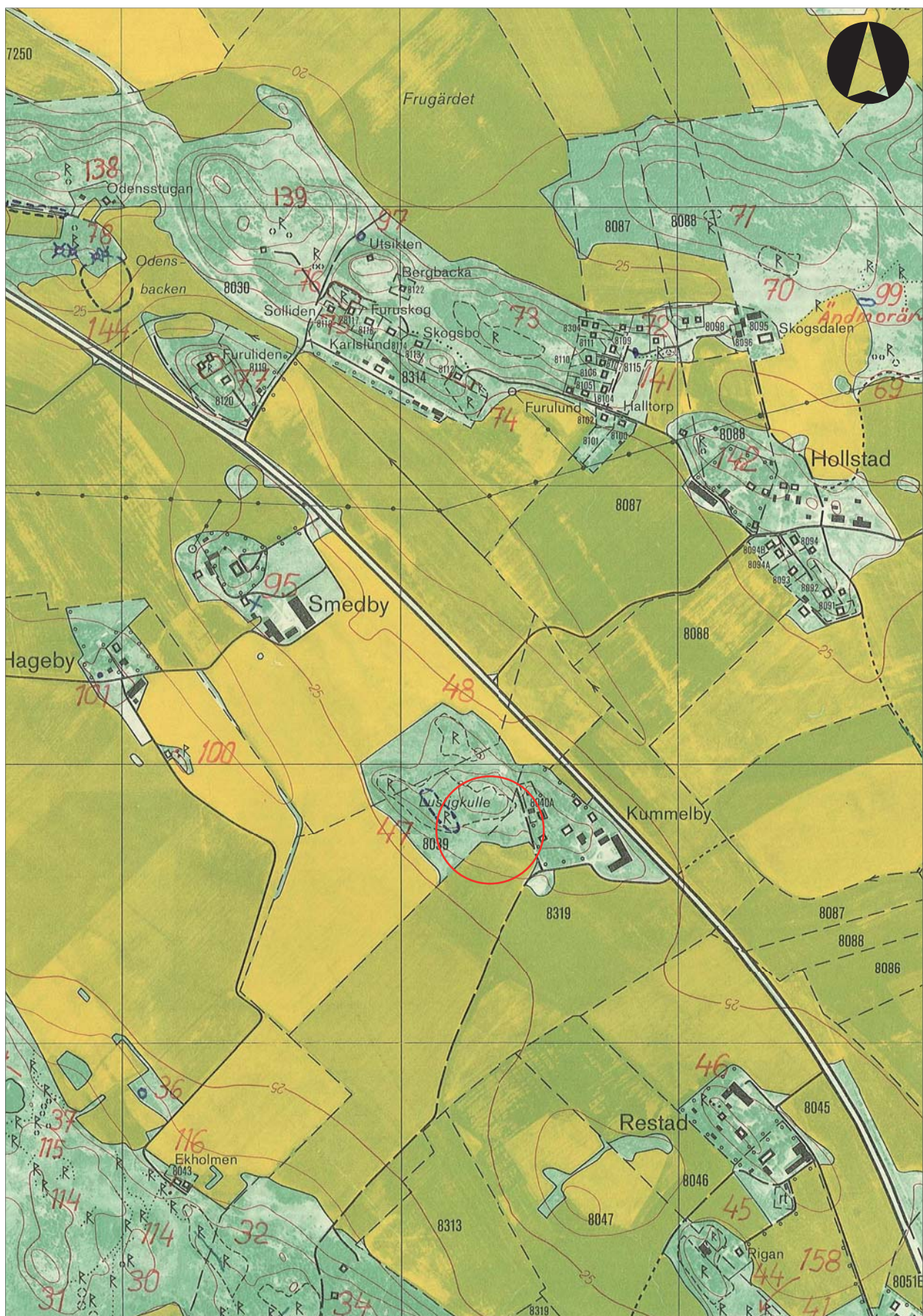
Figur 2. Utdrag ur Ekonomiska kartans blad 086 85 med undersökningsområdet markerat. Skala 1:10 000.