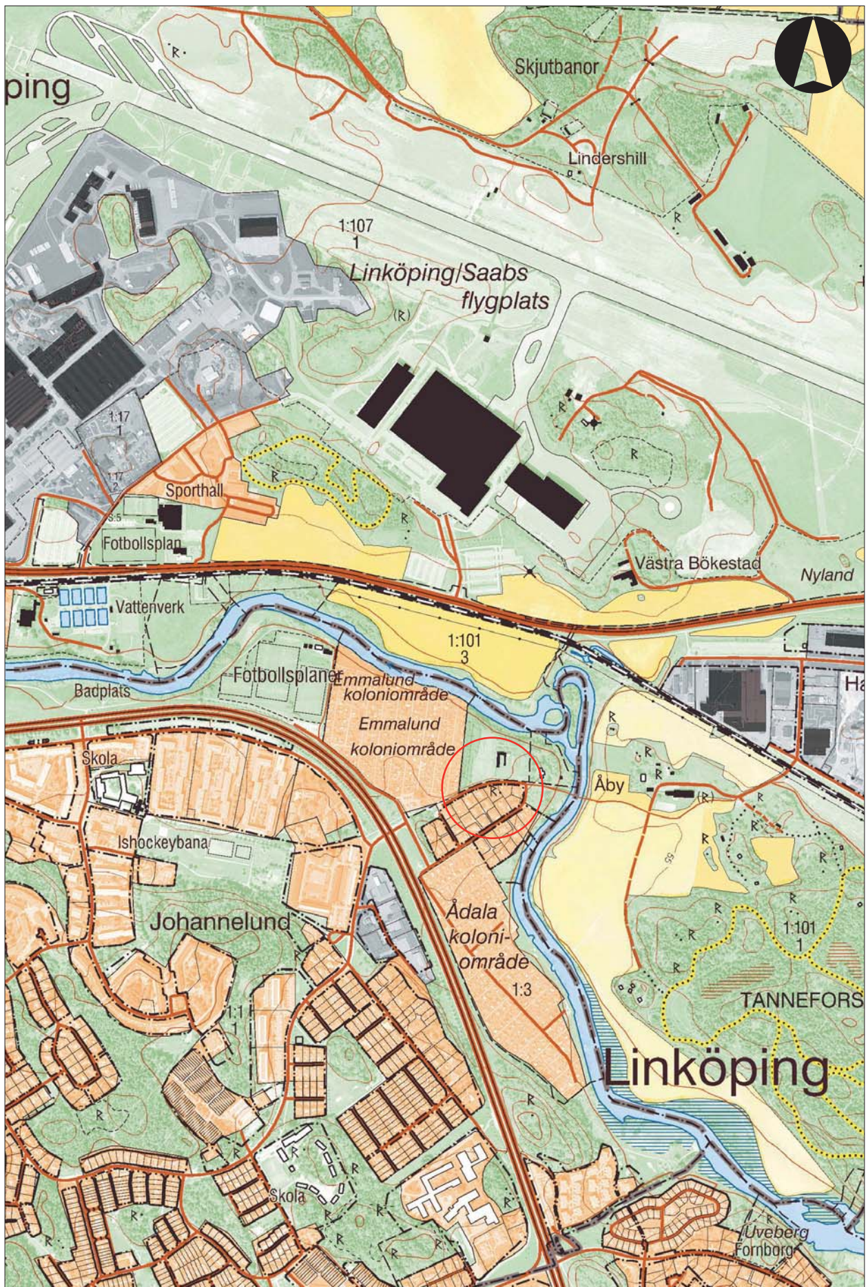
Figur 2. Utdrag ur digitala Fastighetskartan med undersökningsområdet markerat. Skala 1:10 000.