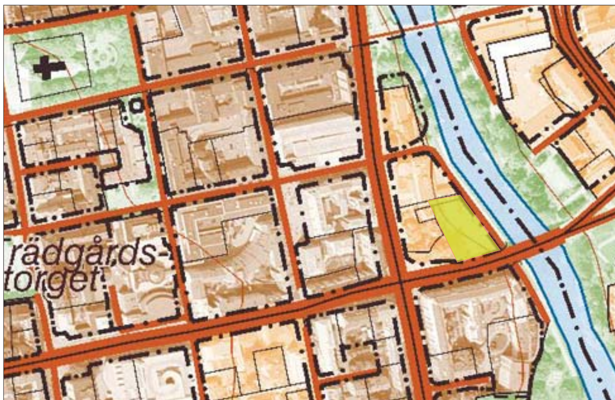
Figur 4. Översiktsplan över det aktuella området. Skala 1:2 500