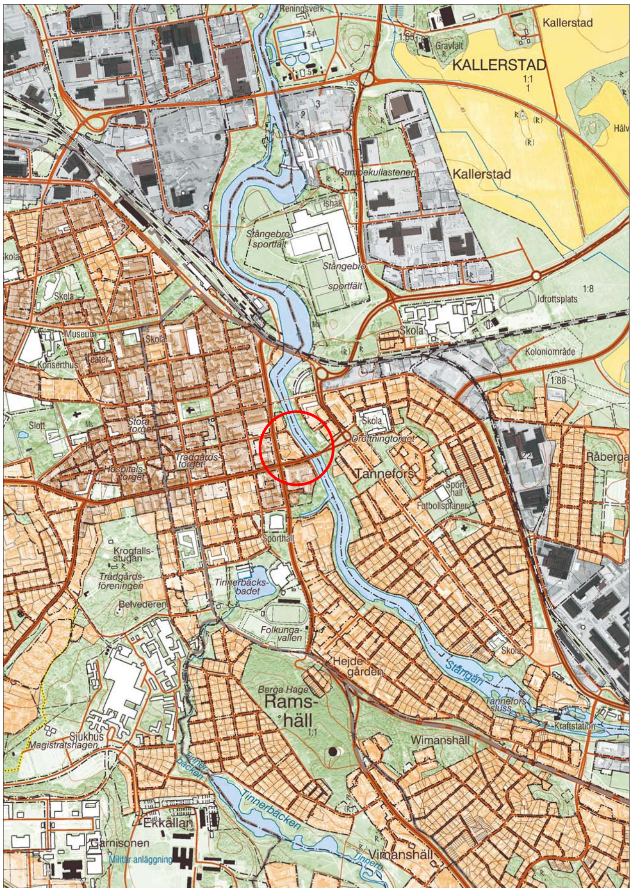
Figur 2. Utdrag ur Digitala fastighetskartan med undersökningsområdet markerat. Skala 1:10 000.