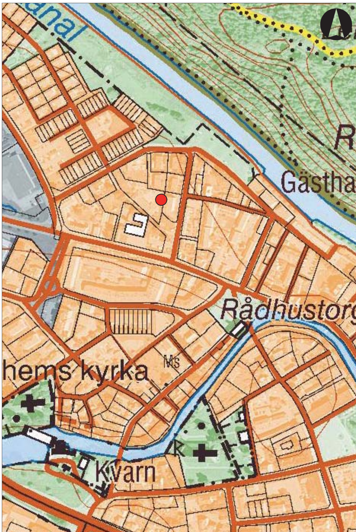
Figur 2. Utdrag ur Fastighetskartan med undersökningsområdet markerat. Skala 1:4000.