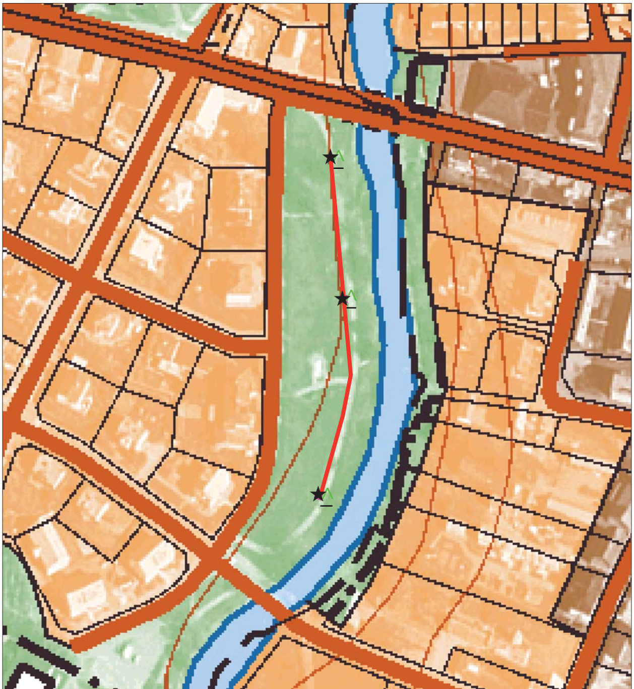
Figur 3. Utsnitt ur Stadskartan med ledningssträckorna och belysningsstolparna markerade.

var ca 0,5 m och för lyktstolpsfundamenten 0,8 m. Schakten mättes in och markerades på karta. Dokumentationsmaterialet förvaras på Östergötlands läns-museum.