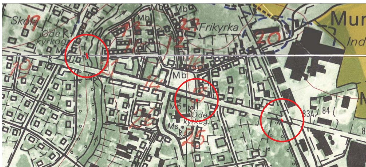
Figur 3. Utdrag ur Ekonomiska kartans blad 085 41 och 085 51 med schakten markerade. Skala 1:5 000.

Ett fåtal undersökningar har genomförts i direkt anslutning till Skenaån. När en ny gång- och cykelbro anlades över Skenaån i höjd med Korpogatan påträffades endast kraftiga påförda sentida utfyllnadsmassor