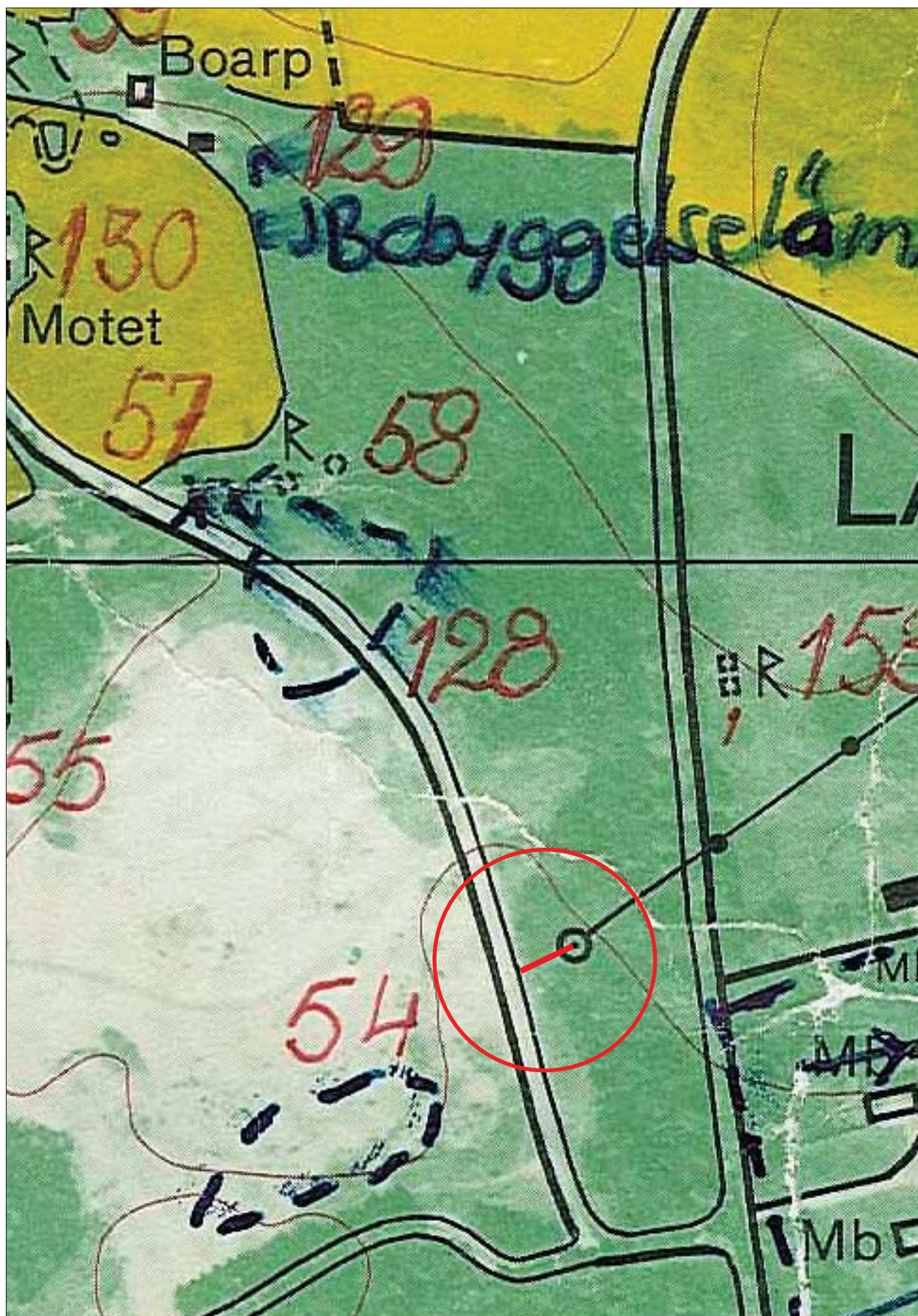
Figur 3. Översiktsplan över det aktuella området med den antikvariska kontrollen markerad. Skala 1:2 500.